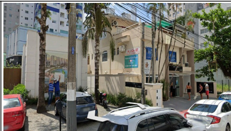
Imagem 03 - Foto do local