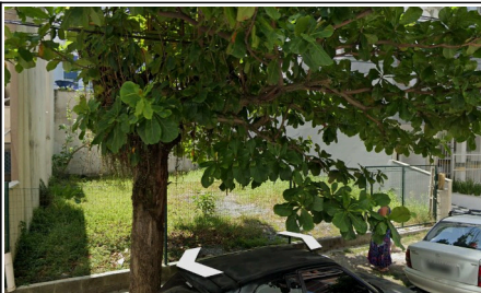
Imagem 02 - Foto do local (Google Earth, 01/2022)